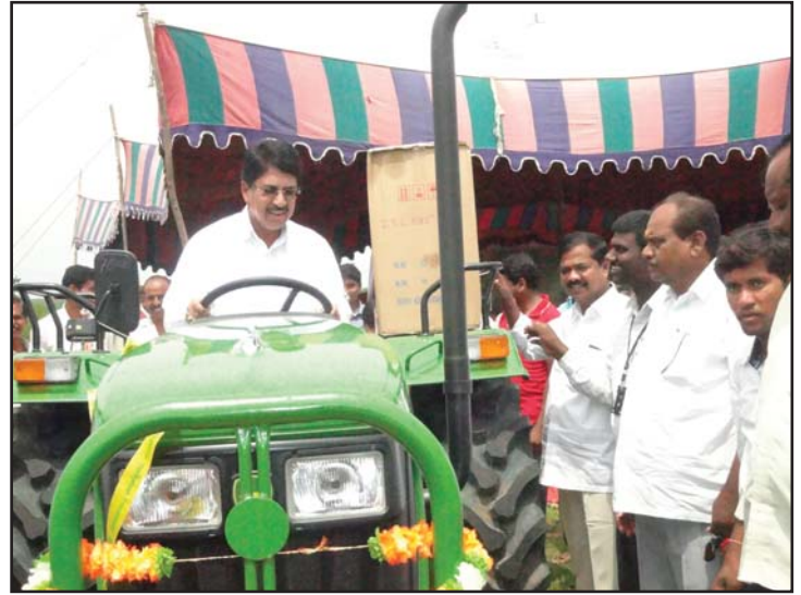
మాజి ఎమ్మెల్యే శ్రీ ప్రవీణ్ రెడ్డి మరియు జెడి సజ్జడికింద అగ్రికల్చర్ ట్రాక్టర్ను బహుకరిస్తున్న దృశ్యం