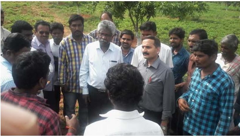
నాబార్డు మాజీ సీజిఎమ్ వి.వి.ఎస్. సత్యనారాయణ టేకుల తాండా క్షేత్ర సందర్శన